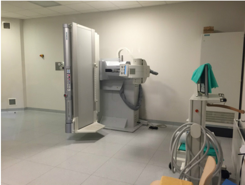
- Radiography 7300C