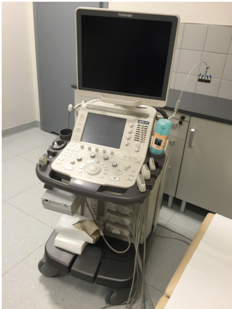
- ProSound Alpha 6 (Aloka)